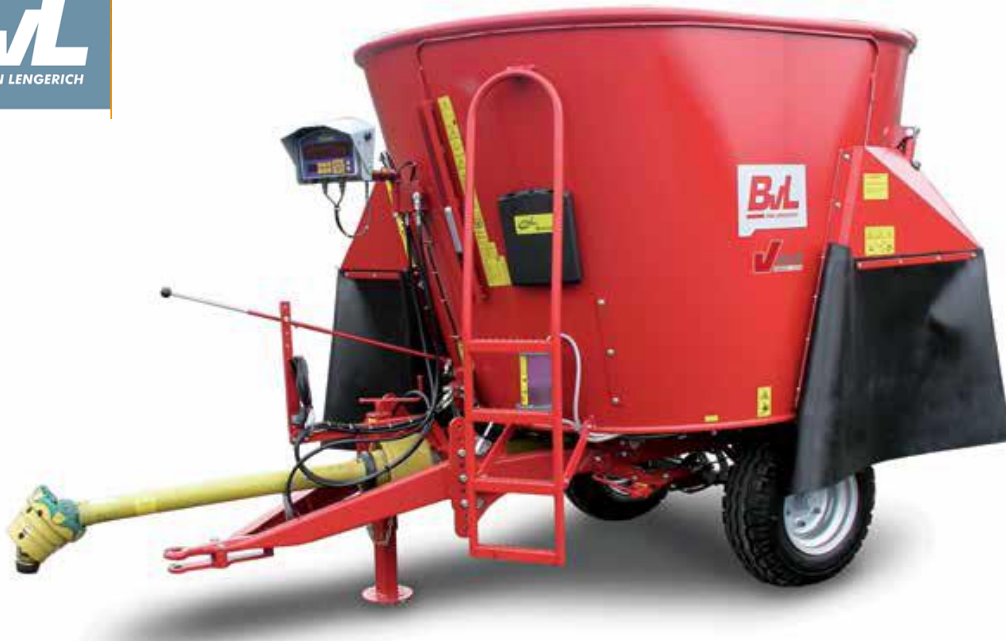
Opšta slika modela BvL V-Mix Agilo 5 – 1S