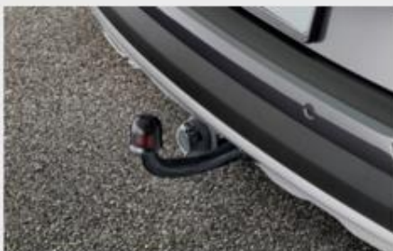
VUČNA KUKA - LOKALNI PROIZVOD (simbolična slika)

Kataloška št. 3130257C MPC 37.648,99 RSD