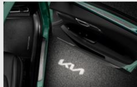
LED OSVETLJENJE VRATA

Kataloška št. R2200ADE10RD MPC 13.676,99 RSD