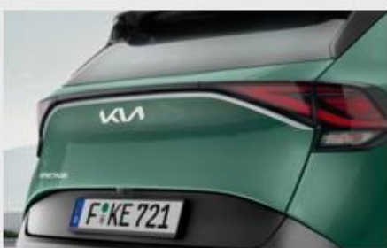
LAJSNA PRTLJAŽNIH VRATA - BRUŠENI ALUMINIJUM

Kataloška št. R2274ADE00BR MPC 14.515,99 RSD