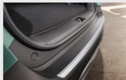
ZAŠTITA BRANIKA, BRUŠENI ALUMINIJUM

Kataloška št. R2271ADE00BL MPC 19.172,99 RSD