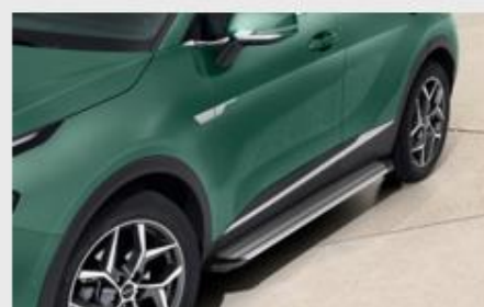
SET BOČNIH PRAGOVA, CRNI DODATAK

Kataloška št. R2200ADE00RD MPC 20.065,99 RSD