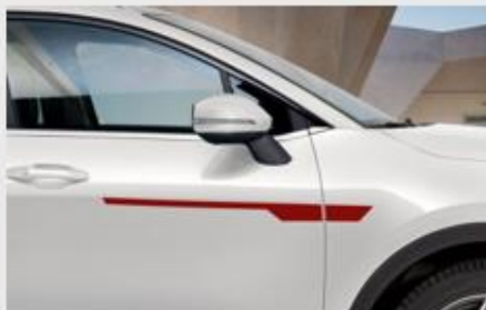
UKRASNE NALEPNICE, CRVENE

Kataloška št. 3130257C MPC 37.648,99 RSD