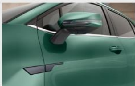
BOČNE UKRASNE LAJSNE

Kataloška št. R2431ADE00BR MPC 14.438,99 RSD