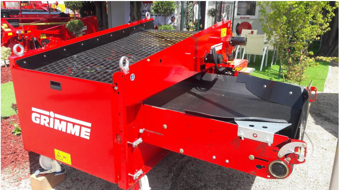
Grimme kalibrator – selektor WG 900