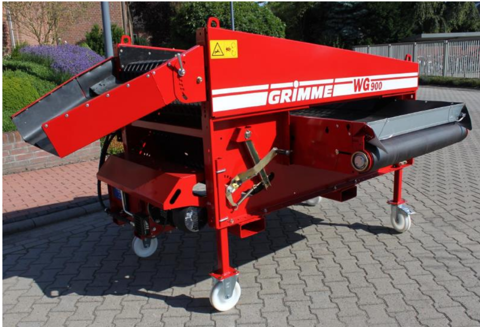
Slika 1. Izgled kalibratora – selektora Grimme WG900