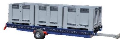
H 1 – 1 Palette