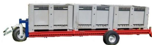
HM 2- 2 Paleta