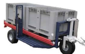
H 3 – 3 Paleta