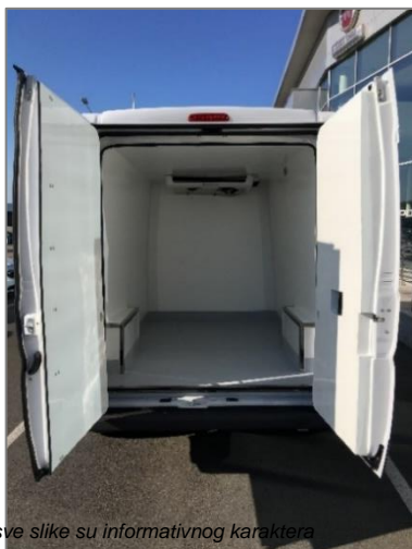
*sve slike su informativnog karaktera